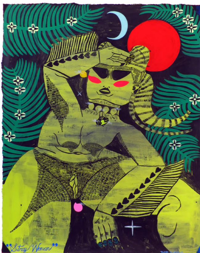
Stray woman (2020) Gouache et acrylique sur papier, 50 x 40 cm