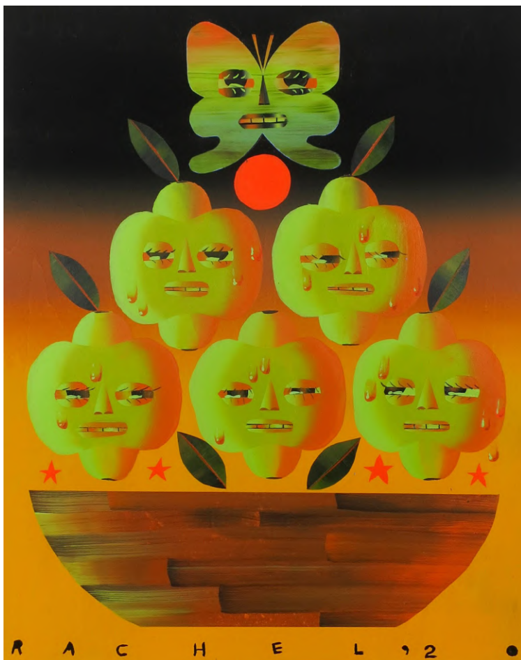
Five Lemons in a Sauna (2020) Acrylique sur bois, 51 x 40,5 cm