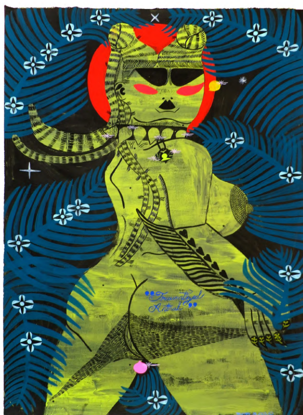
Traumatized animal (2020) Gouache et acrylique sur papier, 50 x 38 cm