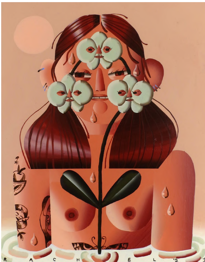
Orchid in the Bathtub (Day) , (2021) Acrylique sur bois, 35 x 28 cm