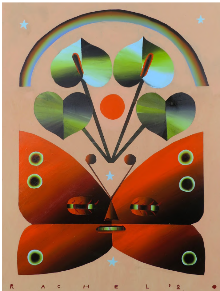
Moth in the Living Room (2020) Acrylique sur bois, 61 x 46 cm