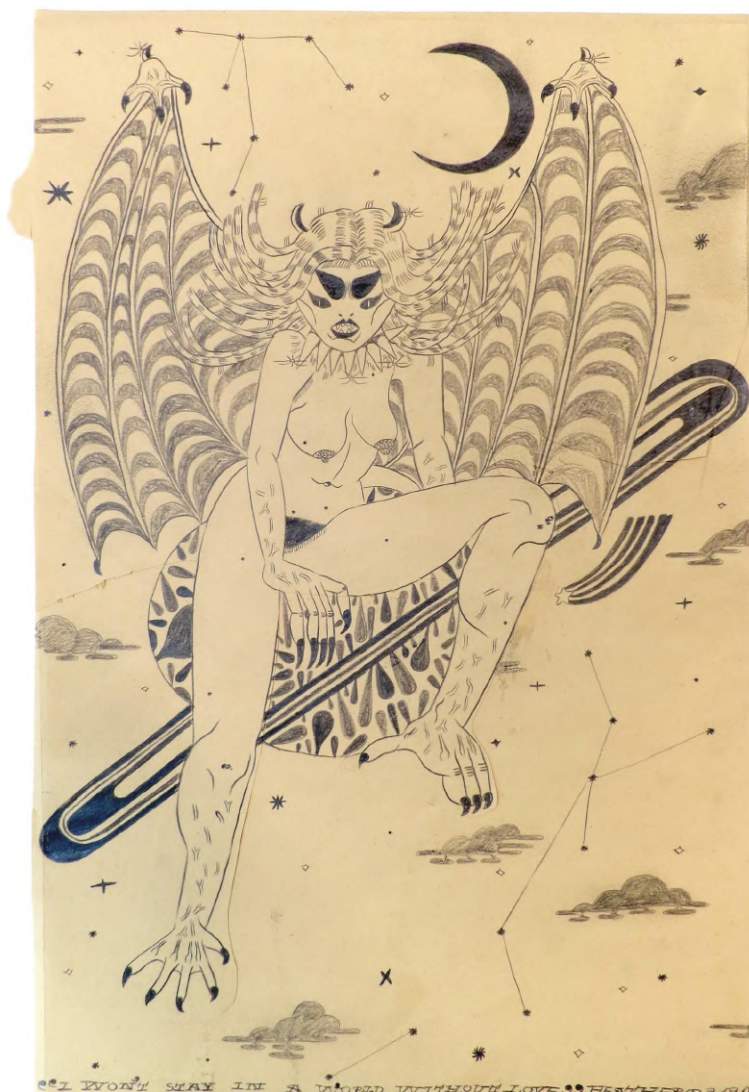
I won't stay in a world without love (2020) Crayon sur papier, 45 x 30 cm