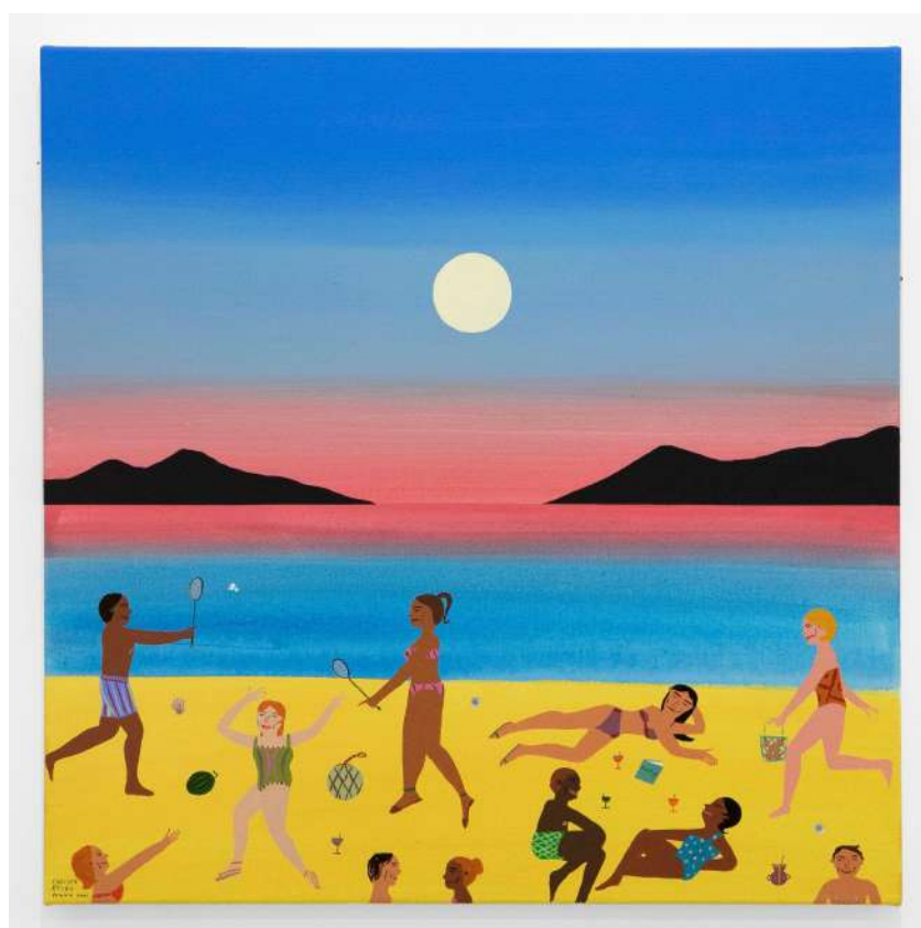
Badminton on the Beach (2021) Acrylique sur toile, 76 x 76 cm

Quelle que soit la technique, Chelsea Wong fait un éloge appuyé à l'art naïf et à la culture populaire, par la création de motifs récurrents et la représentation des corps dans une succession de plans. La peintre affiche un propos féministe intersectionnel et érige son art comme étant radicalement en mouvement.