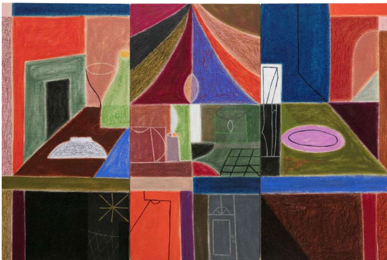
Two tables pushed together to make one big table (2021) Pastel gras sur toile, 61 x 91,5 cm ensemble (triptyque)

A la jonction du figuratif, du symbolisme et de l'abstraction, les peintures de Muzae tiennent autant de la représentation de nos espaces architecturaux que de leur projection mentale, qu'ils s'agissent de souvenirs ou de la manière dont on appréhende ces lieux. Les murs, les escaliers, les meubles et même les perspectives se retrouvent réduits à l'état de simples polygones. L'artiste réagence ces formes géométriques sur sa toile, dans des compositions où l'équilibre repose en grande partie sur la force des couleurs.