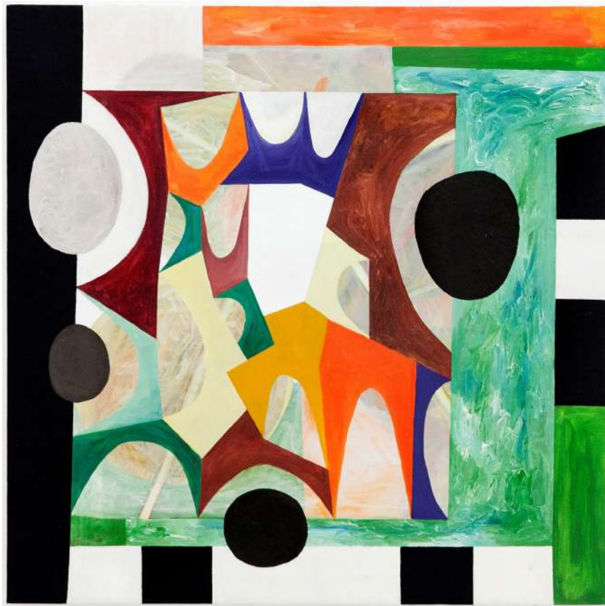
Colorless green ideas sleep furiously (2021) Huile sur toile, 76 x 76 cm