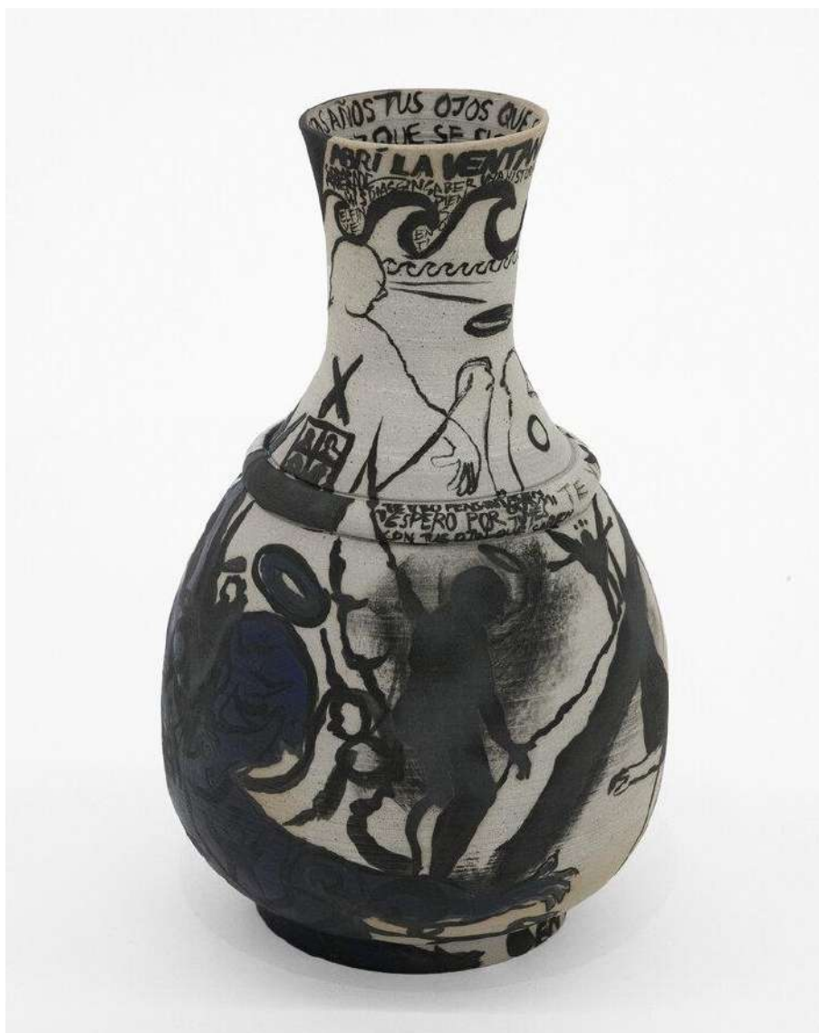
Tus Ojos Que Saben (2021) Céramique et glaise, 26,5 x 15 x 15 cm