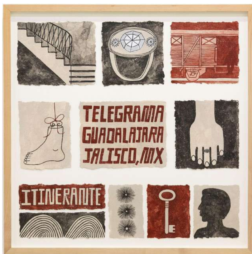
La mano (La main) (2021) Argile, feuille d'argent et peinture vinyle sur papier, 67 x 67 cm

Inspirée par le réalisme magique d'Amérique latine, rejetant le rationalisme pour mieux flatter l'imaginaire, Liz Hernández s'inscrit dans un art onirique, composé avec clarté. En transcrivant dans ses toiles sa relation avec sa grand-mère et son rapport à la ville de son enfance, la peintre mexicaine met en lumière sa propre subjectivité. L'artiste étant plongée depuis ses jeunes années dans une quête de spiritualité, initiée par ses aînés, ses œuvres transpirent le mysticisme et le symbolisme.