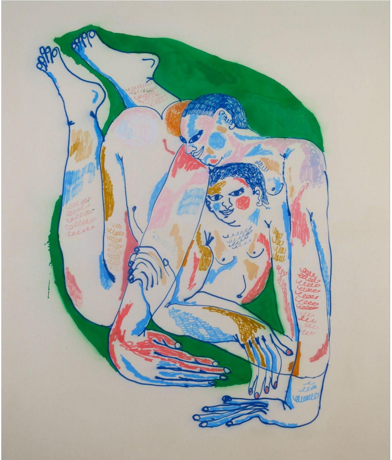
My weight on you (2022) Acrylic airbrush on canvas