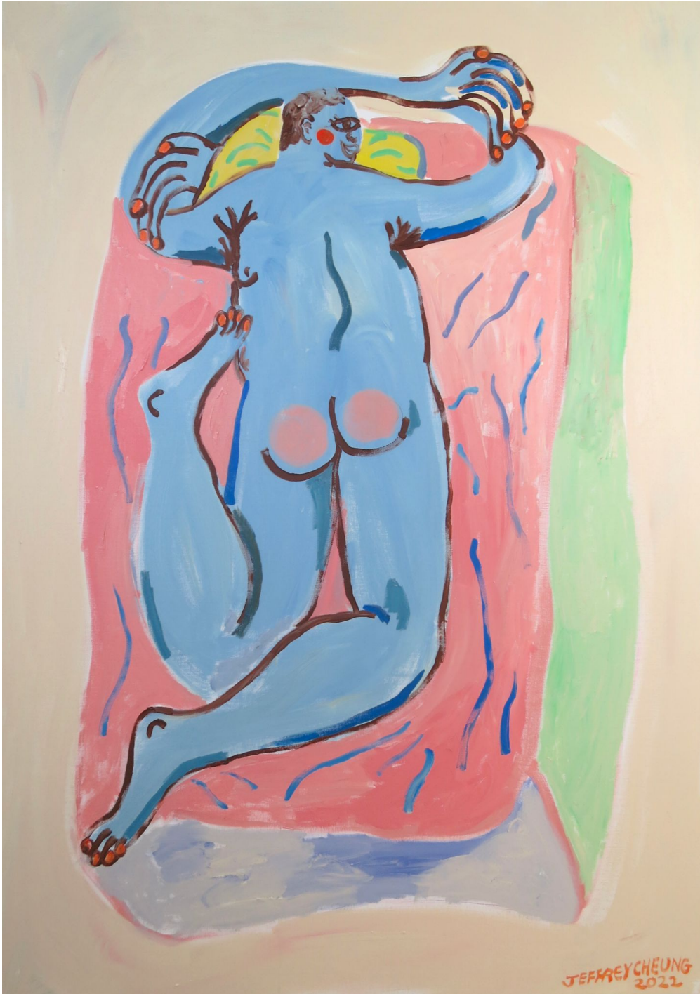
The door is open! And I've been horny my whole life (2022) Acrylic on canvas