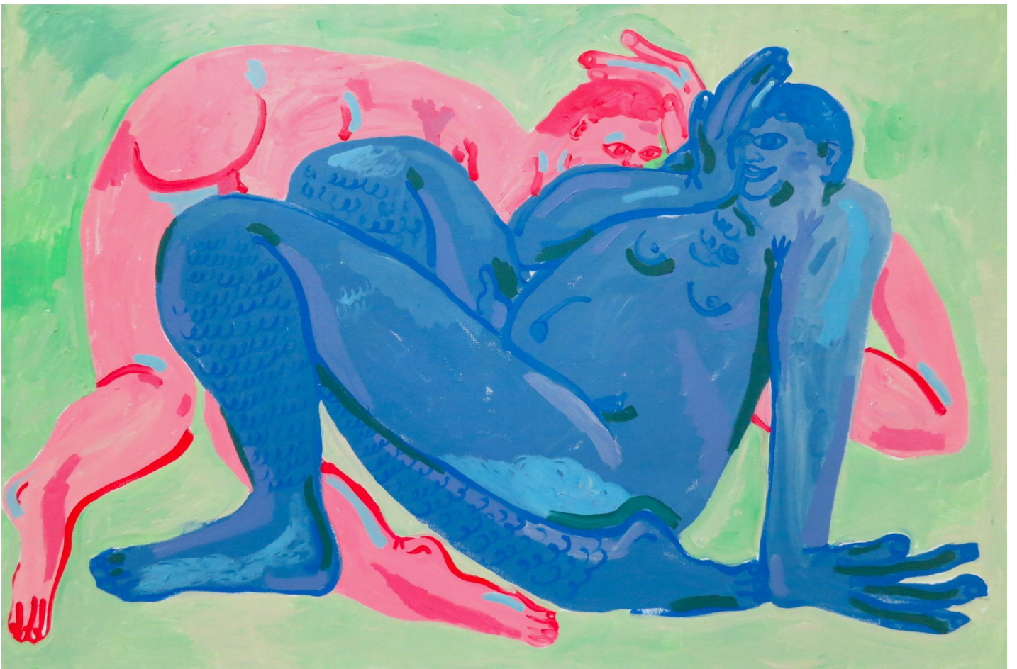
Tell me more (2022) Acrylic on canvas